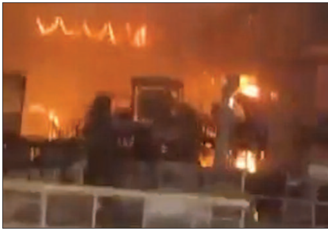
परिजनों के प्रति संवेदना प्रकट की है। उन्होंने घायलों के शीघ्र स्वस्थ होने की कामना करते हुए प्रभावित परिवारों को

मृतकों में से छह के शव स्टील प्लांट के सामान्य अस्पताल पहुंचाए जा चुके थे, जबकि अन्य की तलाश और राहत कार्य जारी था। प्रत्यक्षदर्शियों के मुताबिक, धातु के रिसाव के बाद यूनिट में आग लग गई और कुछ कर्मचारी अंदर फंस गए। सूचना मिलते ही दमकल विभाग और आपदा राहत दल मौके पर पहुंचे तथा आग बुझाने और फंसे हुए कर्मचारियों को निकालने का अभियान शुरू किया। हालांकि देर शाम तक घायल और लापता कर्मचारियों की सटीक संख्या की आधिकारिक पुष्टि नहीं हो सकी थी। प्रधानमंत्री नरेंद्र मोदी ने हादसे पर गहरा दुःख व्यक्त करते हुए मृतकों के