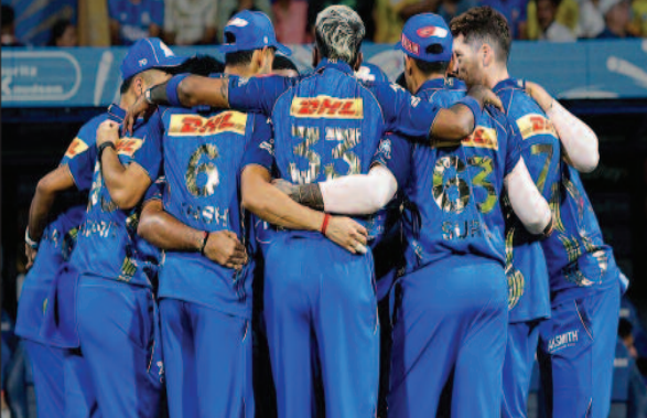
भी उसे नुकसान हुआ है। उसे इस सत्र में प्लेऑफ के लिए अब कम से कम 14 अंकों की जरूरत है। इसके अलावा उसे अपने रनरेट में भी सुधार करना होगा।

एसे में टीम अगर शेष 6 मैचों में से 5 भी जीतती है तो भी उसे प्लेऑफ की संभावनाएं बनी रहेंगी। वहीं अगर वह केवल 4 मैच जीतती है और दो में हारती है तो बाहर हो जाएगी। इस सत्र में अब तक जिस प्रकार से मुम्बई का प्रदर्शन रहा है उससे उसके लगातार मैच जीतने की संभावनाएं कम ही हैं। गत दिवस हुए मैच में उसे 243 रनों का बड़ा स्कोर बनाने के बाद भी सनराइजर्स हैदराबाद के हाथों हार झेलनी पड़ी। टीम की हार का कारण बल्लेबाजों और गेंदबाजों के प्रदर्शन में निरंतरता की कमी है। जिससे टीम नीचे आयी है।