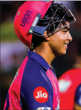
उन्के अब टी20 की 27 पारियों में कुल 99 छक्के हो गए हैं। टी20 में सबसे तेज 100 छक्के लगाने का विध

रिकार्ड अभी पोलार्ड के नाम है। उन्होंने 843 गेंदों में यह उपलब्धि हासिल की थी। वहीं सूर्यवंशी ने अब तक 511 गेंदें ही खेली हैं। ऐसे में उनका नंबर एक पर आना तय है। वैभव ने आईपीएल सत्र की शुरुआत साल 2025 में की थी। तब वह केवल 14 साल की उम्र में खेलने उतरे थे। इस प्रकार वह सबसे कम उम्र में डेब्यू करने वाले खिलाड़ी बने थे। तब उन्होंने लखनऊ सुपर जायंट्स के खिलाफ खेलते हुए पहली ही गेंद पर छक्का लगाया था। वहीं इस सत्र में उन्होंने जसप्रीत बुमराह और पैट कर्मिस जैसे गेंदबाजों पर भी छक्के