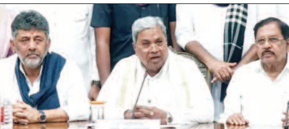
के तौर पर आगे बढ़ने का प्रस्ताव दिया है, जिस पर सिद्धरमैया ने भी सहमति जताई है। पार्टी के भीतर पिछले लंबे समय से नेतृत्व परिवर्तन को लेकर खींचतान चल रही थी, लेकिन अब हालात बदलते नजर आ रहे हैं। राहुल गांधी और सिद्धरमैया के बीच

नई दिल्ली/बंगलुरु, एजेंसी। कर्नाटक की राजनीति में बड़ा घटनाक्रम सामने आया है। मुख्यमंत्री पद से इस्तीफा देने के कुछ घंटों बाद ही पूर्व मुख्यमंत्री सिद्धरमैया ने साफ कर दिया है कि वे राज्यसभा नहीं जाएंगे और सक्रिय राजनीति में विधायक के रूप में ही बने रहेंगे।