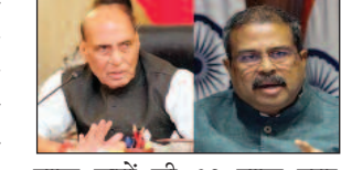
लाख छात्रों की 98 लाख उत्तर पुस्तिकाओं का मूल्यांकन डिजिटल प्रणाली से किया गया था। परिणाम के बाद कई छात्रों ने स्कैन कॉपी, अंकों की गणना और अशुभ मूल्यांकन पर सवाल उठाए हैं। विपक्ष ने मामले में एसआईटी और न्यायिक जांच की मांग की है, जबकि सरकार ने कहा है कि छात्रों के हित में सुधार और समीक्षा की जाएगी। फिलहाल किसी जांच की आधिकारिक घोषणा नहीं हुई है, लेकिन सरकार के रुख से बड़े फैसलों के संकेत मिल रहे हैं।

नई दिल्ली, एजेंसी। सीबीएसई की 12वीं बोर्ड परीक्षा के परिणाम और ऑन-स्क्रीन मूल्यांकन प्रणाली (OSM) में कथित गड़बड़ियों को लेकर केंद्र सरकार ने सख्त रुख अपनाया है। रक्षा मंत्री राजनाथ सिंह के आवास पर हुई उच्चस्तरीय बैठक में शिक्षा मंत्री धर्मदेव प्रधान, पीएमओ अधिकारी और सीबीएसई प्रतिनिधि शामिल हुए। बैठक में डिजिटल मूल्यांकन प्रणाली की खामियों पर चर्चा हुई। शिक्षा मंत्री ने स्वीकार किया कि बड़े स्तर पर लागू डिजिटल मूल्यांकन में कुछ विषमताएं सामने आई हैं। उन्होंने कहा कि छात्रों की शिकायतों को गंभीरता से लिया जाएगा और लापरवाही मिलने पर कार्रवाई होगी। इस साल करीब 17