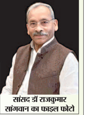
सांसद डॉ. राजकुमार सांगवान का फाइल फोटो

मोदीनगर (शिखर समाचार)। बागपत मोदीनगर लोकसभा क्षेत्र के सांसद डॉ. राजकुमार सांगवान ने ईसापुर भदोला तौड़ी मार्ग की जर्जर स्थिति को लेकर लोक निर्माण विभाग के अधिकारियों पर नाराजगी जताई है। सड़क पर जगह जगह बड़े बड़े गड्ढे होने तथा कई स्थानों पर जलभराव की समस्या के कारण लोगों को भारी परेशानी का सामना करना पड़ रहा है। हालत यह है कि राहगीरों और वाहन चालकों के लिए इस मार्ग से गुजरना तक मुश्किल हो गया है। सांसद डॉ. राजकुमार सांगवान ने बताया कि क्षेत्र के लोगों ने उनसे सड़क की खराब स्थिति की शिकायत की थी। इसके बाद उन्होंने मामले को गंभीरता से लेते हुए संबंधित अधिकारियों से वार्ता की। उन्होंने बताया कि इस मार्ग के पुनर्निर्माण के लिए शासन को प्रस्ताव भेजा जा चुका है, लेकिन अभी तक बजट के गड्ढे को भरवाने का कार्य भी शुरू कर दिया जाएगा। सांसद डॉ. राजकुमार सांगवान ने कहा कि वह इस मार्ग के लिए शीघ्र बजट स्वीकृत करने हेतु शासन स्तर पर लगातार प्रयास कर रहे हैं, ताकि क्षेत्रवासियों को बेहतर सड़क सुविधा उपलब्ध कराई जा सके।