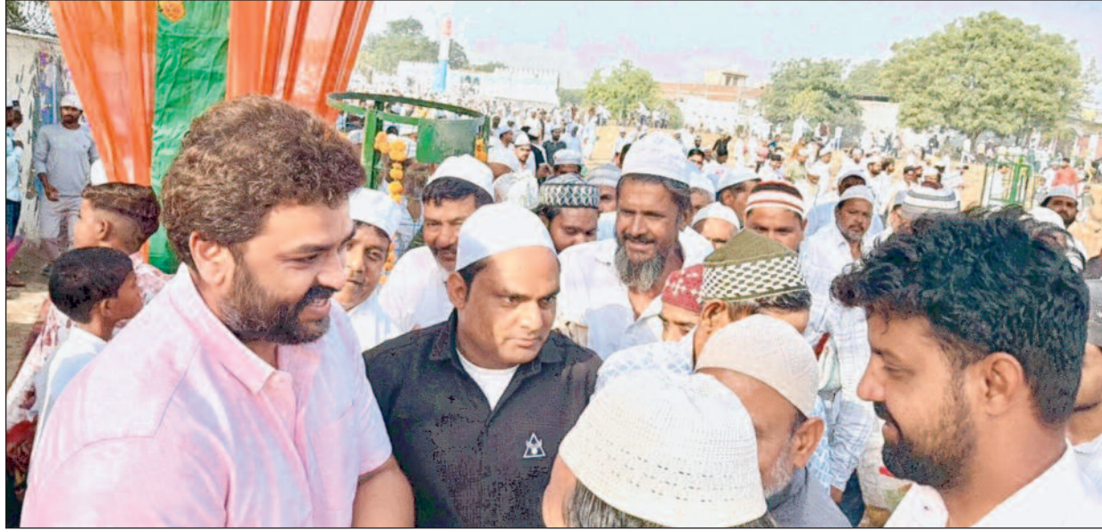
माहौल बना रहा। बच्चों में पर्व को लेकर विशेष उत्साह दिखाई दिया। बच्चे नए कपड़े पहनकर एक दूसरे को बधाई देते नजर आए, वहीं घरों

रबूपुरा (शिखर समाचार)। कस्बा रबूपुरा सहित आसपास के ग्रामीण क्षेत्रों में गुरुवार को ईद उल अजहा का पर्व पूरे हर्षोल्लास, आपसी सौहार्द और भाईचारे के साथ मनाया गया। सुबह से ही मुस्लिम समाज के लोगों में पर्व को लेकर खासा उत्साह देखने को मिला। लोगों ने नए वस्त्र पहनकर ईदगाह एवं मस्जिदों में पहुंचकर नमाज अदा की और देश-दुनिया में अमन, चैन, तरक्की एवं भाईचारे की दुआ मांगी।