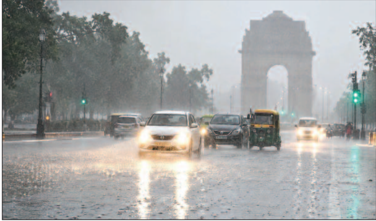
मौसम में यह बदलाव पश्चिमी विक्षोभ और स्थानीय मौसमी परिस्थितियों के कारण देखा जा रहा है, जिसका असर दिल्ली, नोएडा, गाजियाबाद, गुरुग्राम और फरीदाबाद सहित पूरे एनसीआर क्षेत्र में दिखाई दे रहा है।

नई दिल्ली, एजेंसी। दिल्ली-एनसीआर में गुरुवार को मौसम ने अचानक बड़ा बदलाव लिया और दिल्ली के साथ-साथ नोएडा और गाजियाबाद में झमाझम बारिश दर्ज की गई। तेज हवाओं और काले बादलों के बीच हुई बारिश से पूरे क्षेत्र में मौसम सुहावना हो गया। बारिश के बाद तापमान में गिरावट दर्ज की गई है और लोगों को भीषण गर्मी से बड़ी राहत मिली है। तेज हवाओं के साथ कई इलाकों में बादल छाप रहे और रुक-रुककर बारिश होती रही। बारिश के चलते सड़कों पर गाड़ियों जाम लगा रहा।