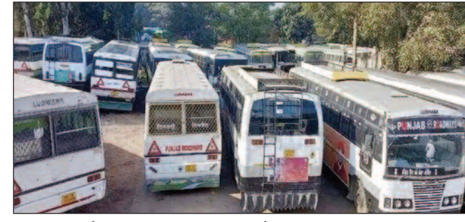
भगवत मान और परिवहन मंत्री के साथ जल्द बैठक कराने की मांग की गई, ताकि निजी बस उद्योग को बचाने के लिए ठोस समाधान निकाला जा सके। यूनियन के अनुसार पंजाब में करीब 2,500 बड़ी निजी बसें और 5,000 मिनी बसें संचालित हो रही हैं। ग्रामीण

चंडीगढ़, एजेंसी। पंजाब में निजी बस उद्योग गहरे आर्थिक संकट से जूझ रहा है। बढ़ती परिचालन लागत, सरकारी बसों में महिलाओं को मुफ्त यात्रा सुविधा और लगातार घटती सवारियों के कारण निजी बस ऑपरेटरों ने सरकार से तत्काल राहत की मांग की है। पंजाब मोटर यूनियन प्राइवेट बस ऑपरेटर पंजाब ने स्पष्ट किया है कि वह जनता पर अतिरिक्त बोझ डालने के पक्ष में नहीं है, इसलिए किराया नहीं बढ़ाया जाएगा, लेकिन सरकार को टैक्स और अन्य शुल्कों में राहत देनी होगी। यूनियन पदाधिकारियों ने ट्रांसपोर्ट विभाग के सचिव वरुण रूजम से मुलाकात कर उद्योग की समस्याओं से अवगत कराया। साथ ही मुख्यमंत्री